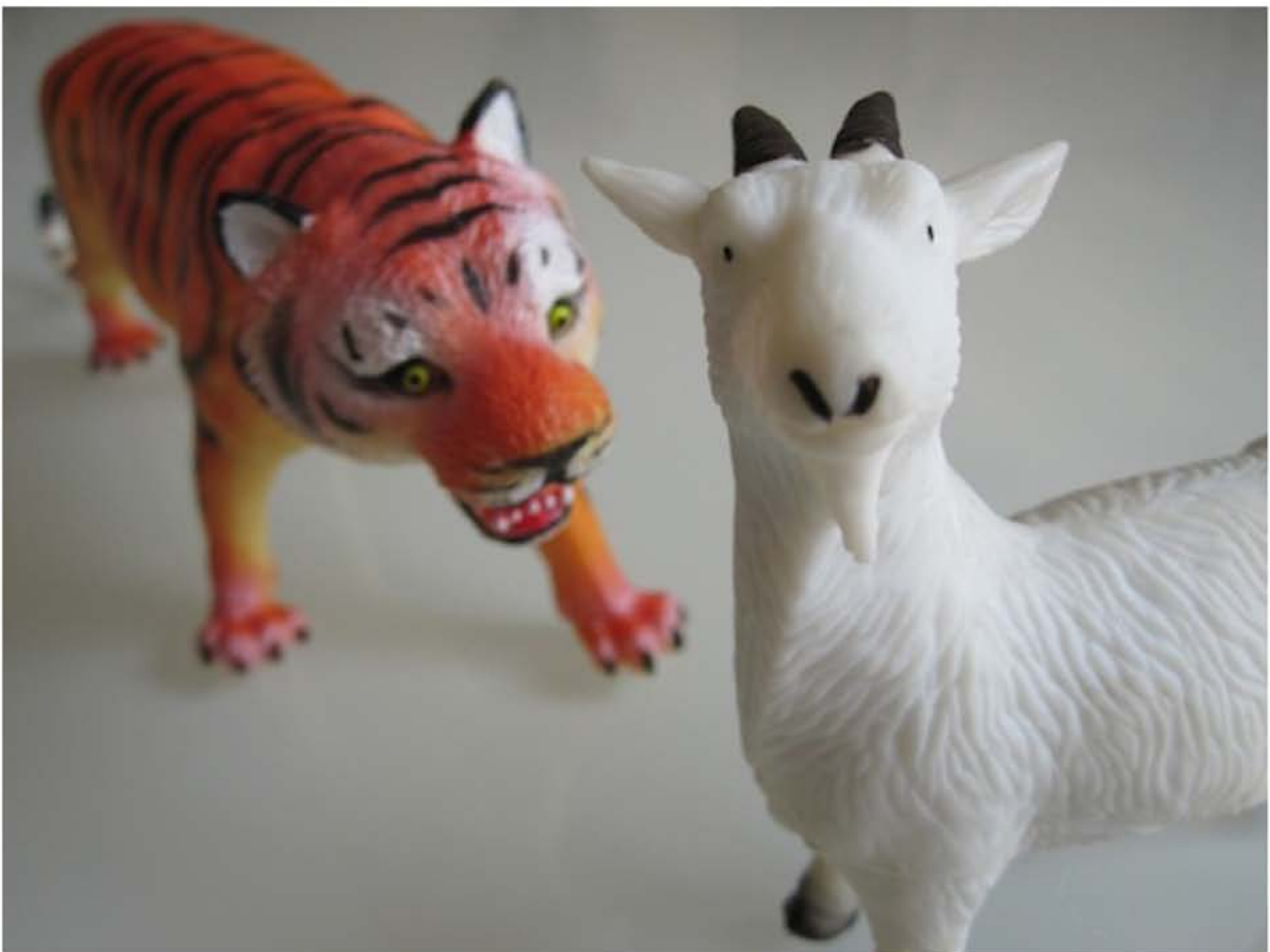
Federico Basso. Smile!